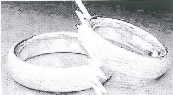
Las nulidades eclesiásticas no son solo para los ricos y famosos.

En cuanto a las tasas que hay que abonar al Tribunal para la tramitación del procedimiento, son las mismas para cualquier persona, con independencia del